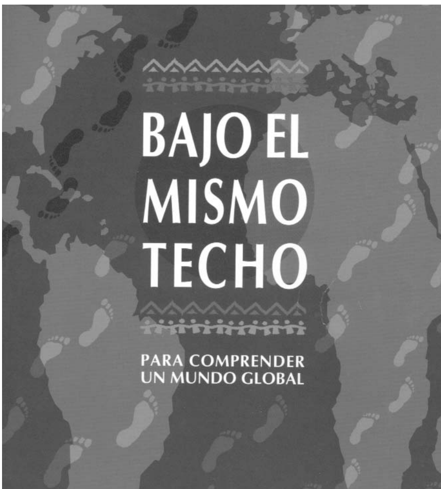
Libro editado por Hegoa y Mugarik Gabe.

Seattle eta gero, globalizazioaren aurka altxatea, aukera bat bihurtu zen.