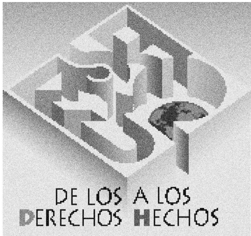
Exposición itinerante de Amnistía Internacional y Mugarik Gabe.

M.R: La principal característica de esta realidad es el PLURALIS-